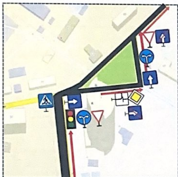
Схема учебного маршрута №2

Период действия с "01" 01 2022 г. по "01" 01 2023 г.