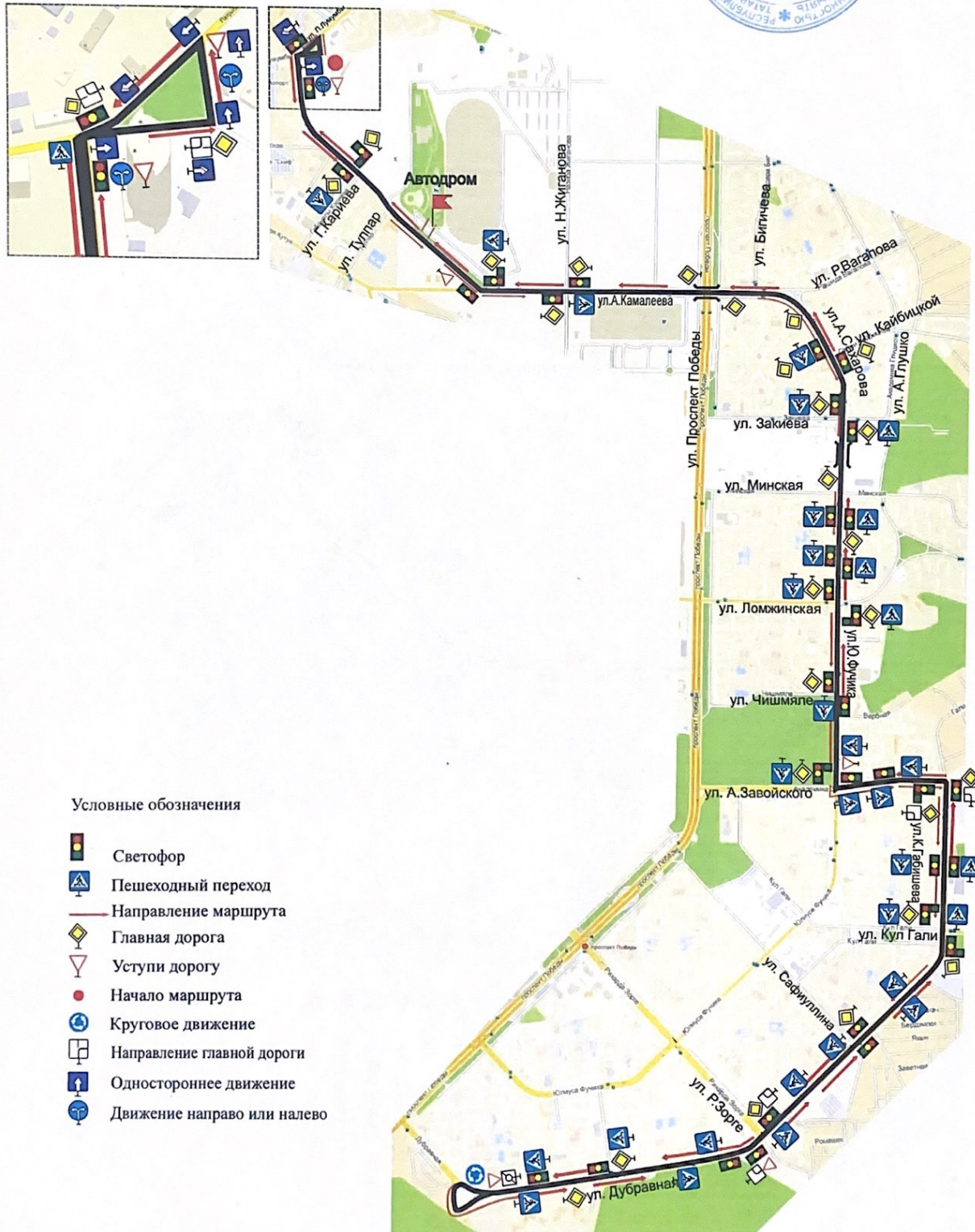
Схема учебного маршрута №4

Период действия с "01" 01 2017 по "31" 01 2017